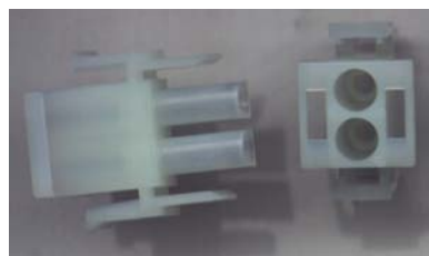
Figur 2 "Beweglicher Verbinder Mate-N-Lok 2x1"

Dieser Typ von beweglichem Verbinder wird für den Anschluß der Kommunikationskabel (A und B) an den Speiser benutzt (siehe Anwendungshinweis AS 0000) und zum Anschluß des Sonnenkollektors (siehe AS 0002) ohne die Verwendung des äußeren Reglers.