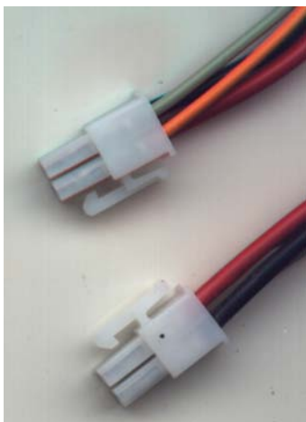
Figur 3 "Beweglicher Verbinder MiniFit 2x2"

Dieser bewegliche Verbinder dient dazu, gleichzeitig die Speisung (+12 V) und die Drähte zur Kommunikation (A B) an die Zentrale anzuschließen (siehe Anwendungshinweis AS0003)